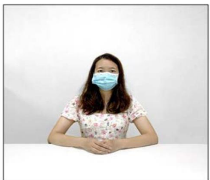
图2：正前方第一机位效果图